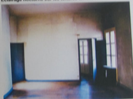
Une des quatre pièces dépourvus d'aménagements.