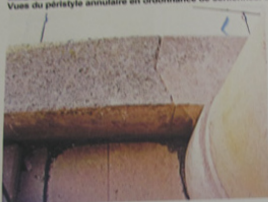
Détail du parapet.