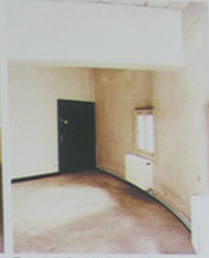
Faux plafond et encoffrement.