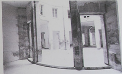
Gourbeix. Vers 1966.