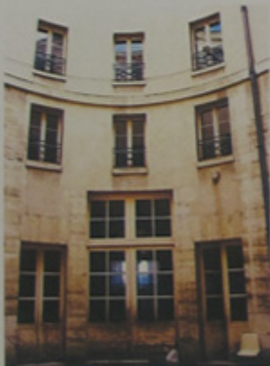
Les menuiseries sur la cour.