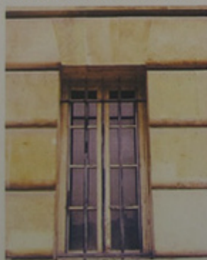
Détail d'une baie.