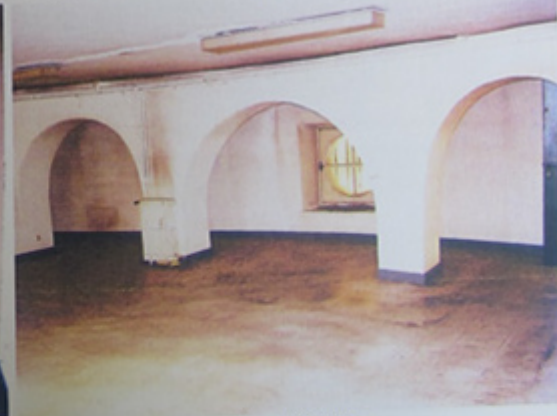
Vue vers l'oculus d'un des péristyles.

Paris XIX e - Rotonde de la Villette - Restauration du clos et couverts Jean-François LAGNEAU - Architecte en chef des Monuments Historiques - Avril 2009