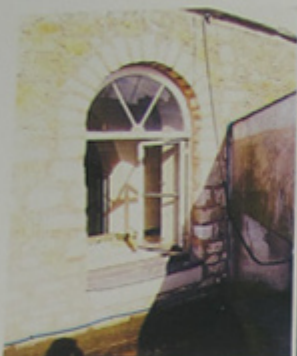
Accès aux courettes.