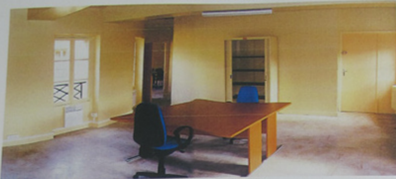
Aménagement d'une des pièces de l'étage en salle de réunion.