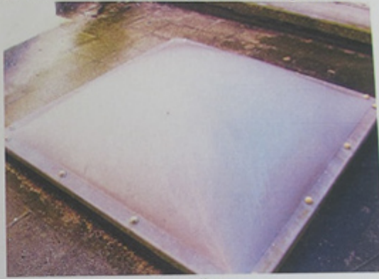
« Skydome » dans une courette.