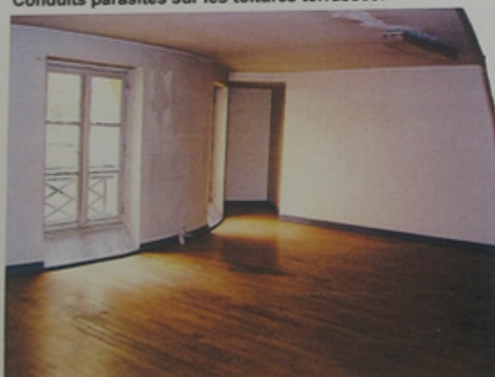
Une des quatre pièces donnant sur la cour intérieure.