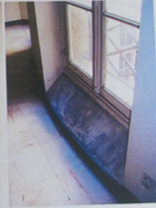
Appuis en glacis sur cour.