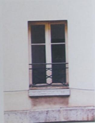
Détail d'une fenêtre.