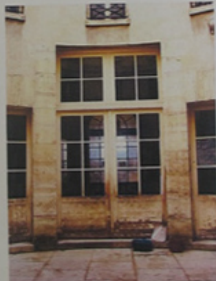
Détail d'une porte-fenêtre.