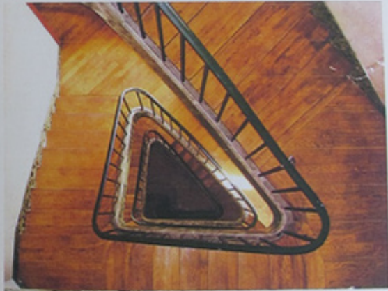
Vue plongeante dans le vide d'un des deux escaliers.