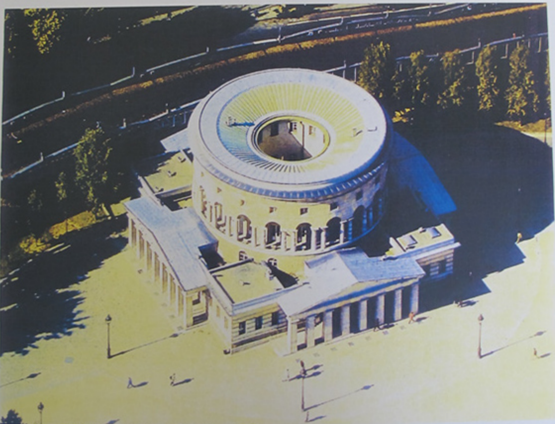
Vue aérienne de l'édifice depuis l'angle Est. Etat vers 2000.

Paris XIX e - Rotonde de la Villette - Restauration du clos et couverts Jean-François LAGNEAU - Architecte en chef des Monuments Historiques - Avril 2009 1