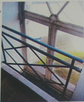
Accès aux courettes.