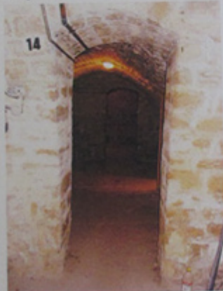
Passage entre salles voûtées.