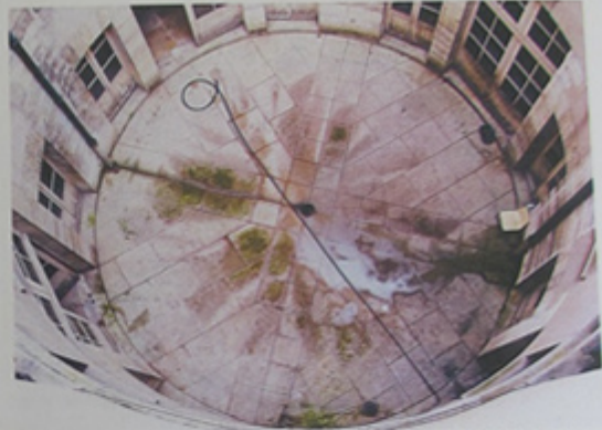
La cour circulaire vers le sol en pierre de facture récente.