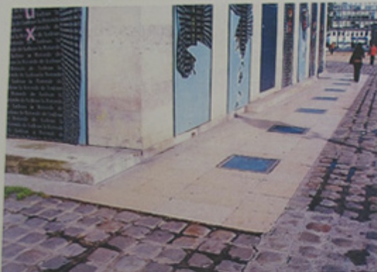
Vue du traitement de sol des abords immédiats.