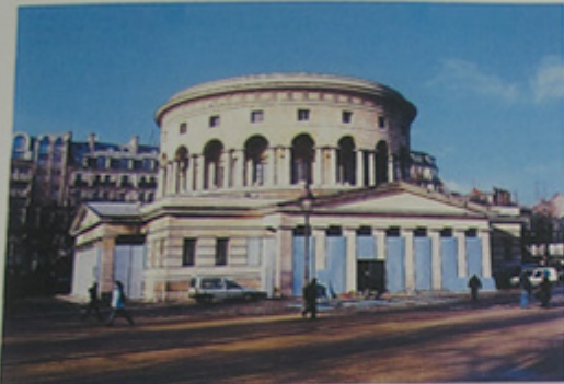
Vue depuis l'esplanade de la Rotonde.