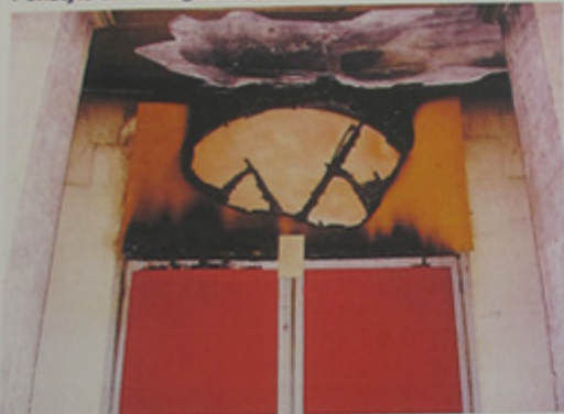
Péristyle de la Villette depuis l'intérieur.