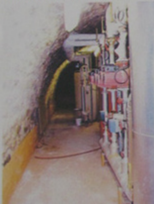
Local CPCU, côté bd la Villette.