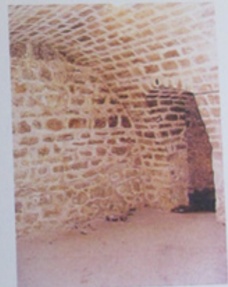
Passage entre salles voûtées.