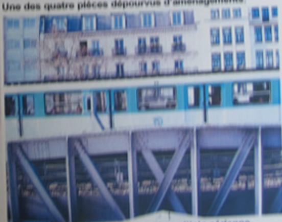
Promiscuité avec la ligne de métropolitain aérienne.

Paris XIX e - Rotonde de la Villette - Restauration du clos et couverts Jess-François LAGNEAU - Architecte en chef des Monuments Historiques - Avril 2009 5