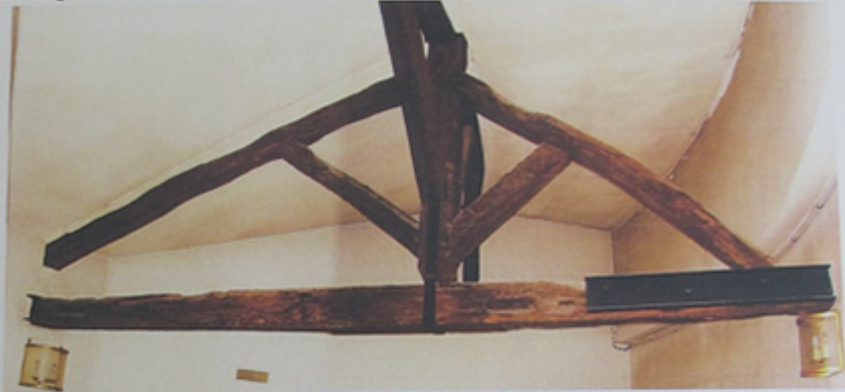
Détail d'une ferme complète consolidée par des profilés métalliques en U moisés.