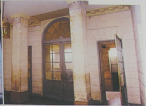
Péristyle d'Allemagne depuis l'intérieur.