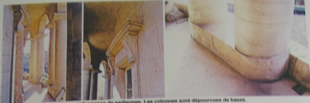
Vues du péristyle annulaire en ordonnance de serliennes. Les colonnes sont dépourvues de bases.