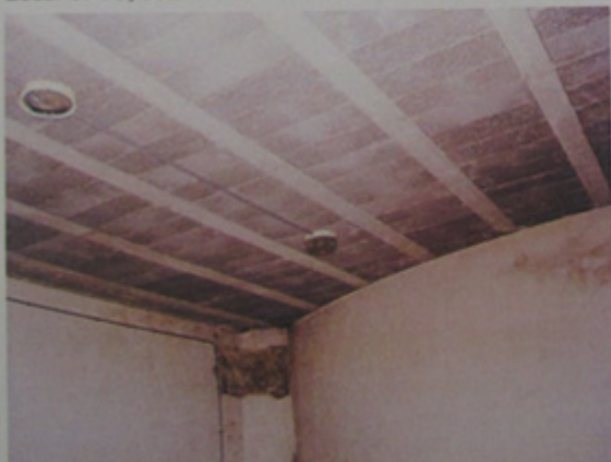
Salle récemment créée par excavation.