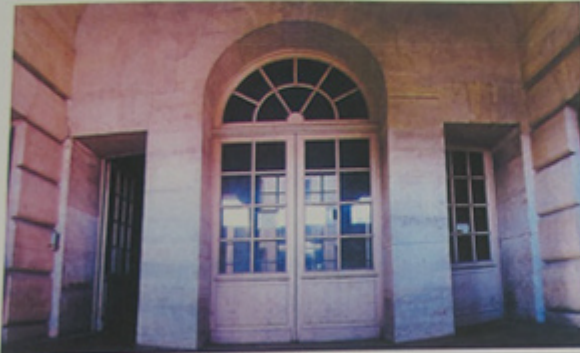
Péristyle d'Allemagne depuis l'extérieur.