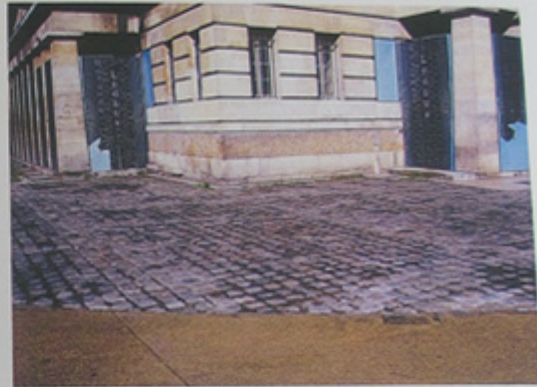
Vue du traitement de sol des abords immédiats.