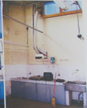
Pièce d'angle vers l'Est.