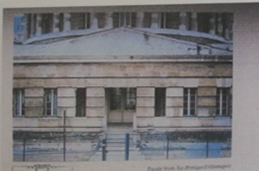
Vers 1980.