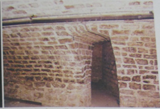
Passage entre deux salles voûtées.