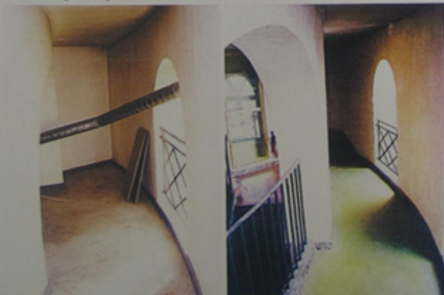
Adaptation d'une ventilation.