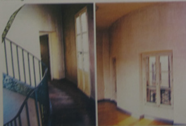
Pallier de la circulation annulaire. Fenêtres sur cour d'un salon.