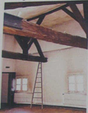
Deux fermes par pièce.