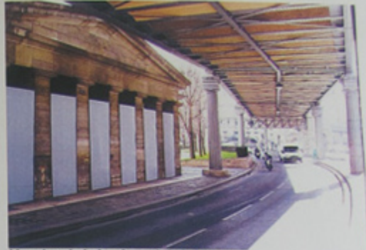
Vue depuis le boulevard de la Villette.