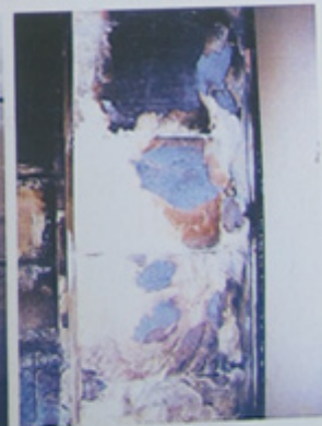
Péristyle de la Villette.