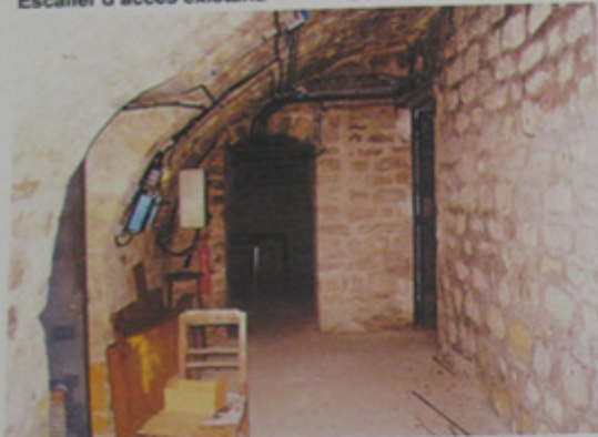
Salle voûtée sous emmarchement d'un des péristyles.