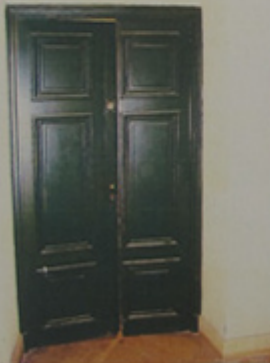
Double porte intérieur.