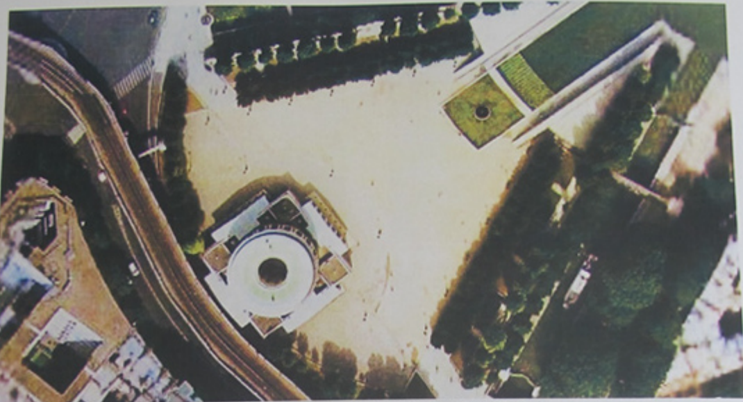
Vue aérienne de l'édifice, de l'esplanade de la Rotonde et des abords du canal Saint Martin.