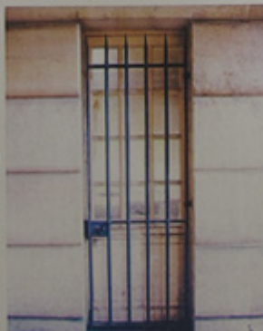
Détail d'une porte.