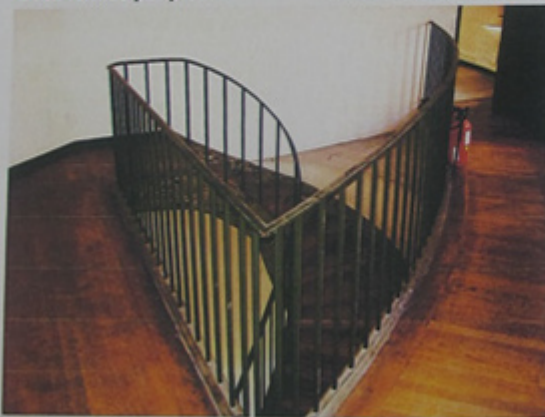
Dernier palier d'un des deux escaliers.