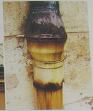
Détail d'une descente pluviale.