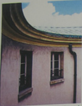
La toiture est traitée en cuivre et en plomb sur la zone formant le terrasson.