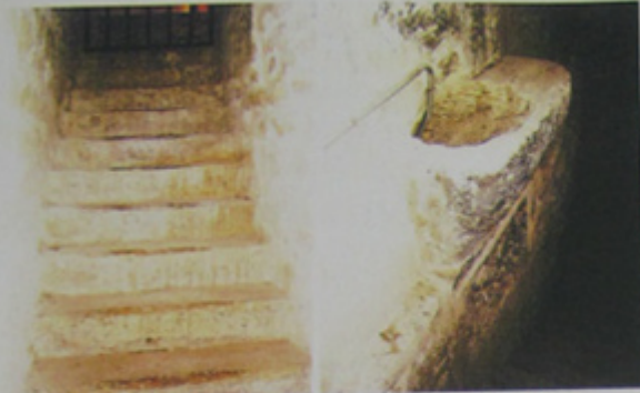
Escalier d'accès existant.