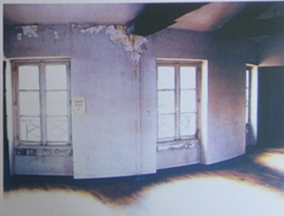
Les fenêtres donnant sur la façade sur cour.