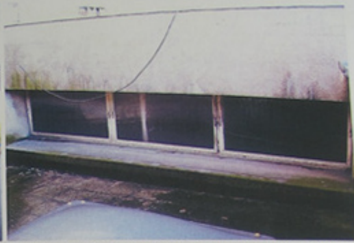
Surélévation des pièces d'angles pour éclairage zénithal.