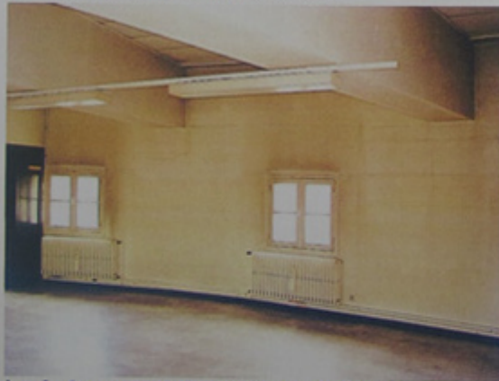
Les fenêtres donnant sur la façade extérieure.