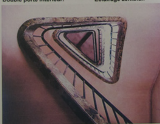
Détails d'un des deux escaliers desservant l'ensemble des étages supérieurs.