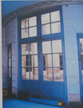
Menuiserie sur cour.