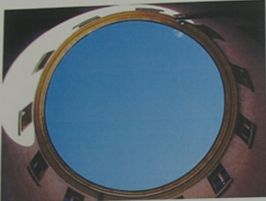
La cour circulaire vers le ciel.