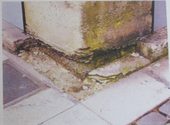
Vue du traitement de sol des abords immédiats.