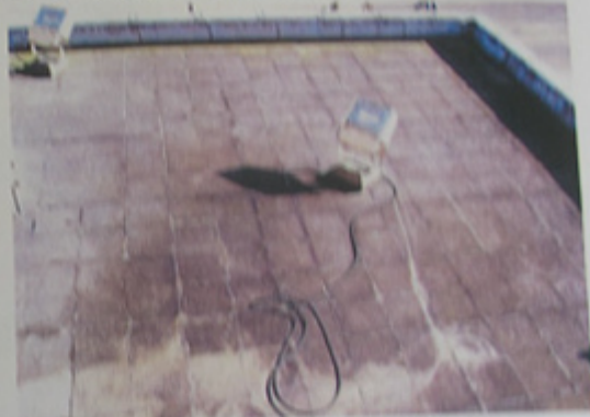
Eclairage nocturne sur les toitures terrasses.