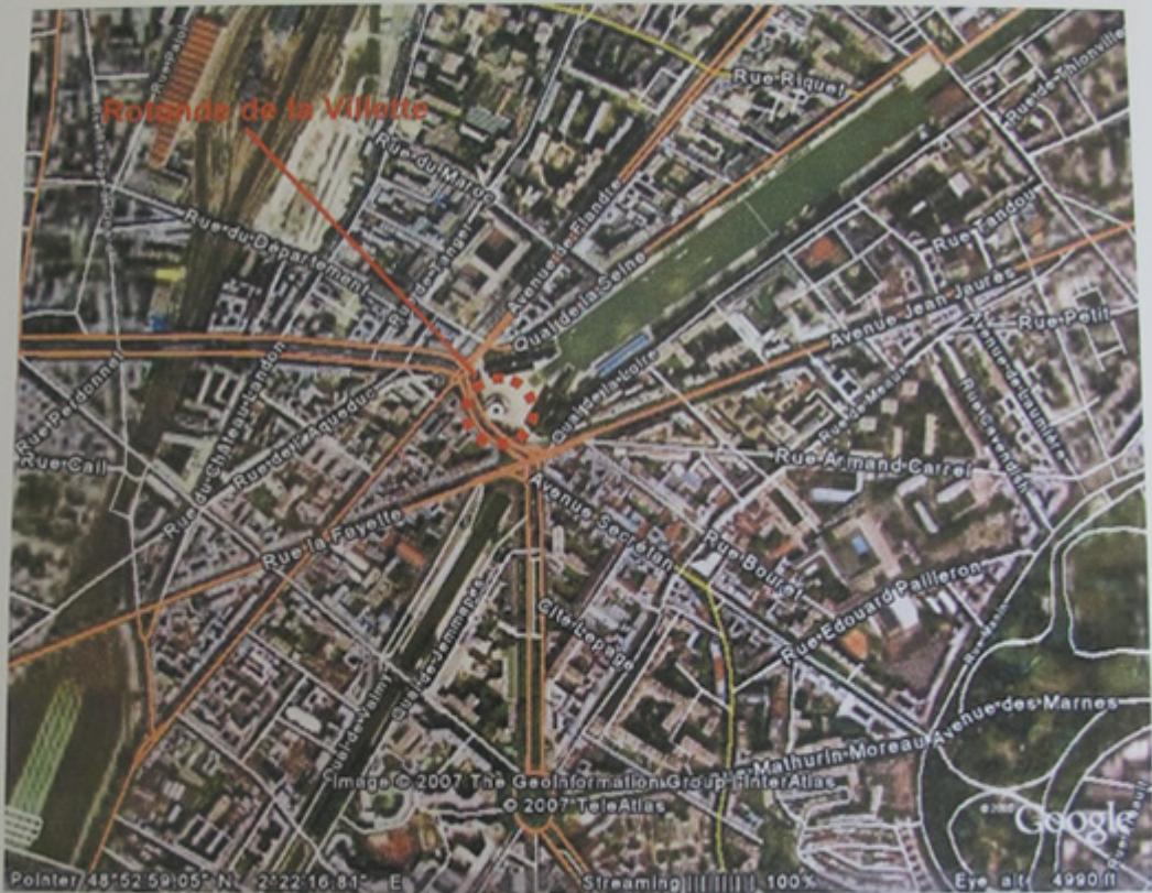
Plan de situation. Section cadastrale AR 41.