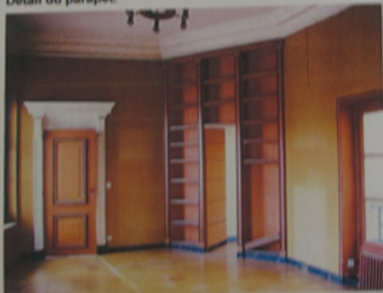
Aménagement « moderne » de la CVP dans l'un des pièces.