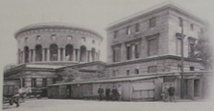
Eugène Atget. Vers 1900.

L'importante campagne de travaux intervient dès le début des années 1960 avec l'installation de la Commission du Vieux Paris. De cette période datent l'ensemble des aménagements intérieurs, tant structurels pour les planchers que décoratifs. Nous pouvons avancer que mis à part les gros murs, il ne subsiste rien des dispositions d'origines.