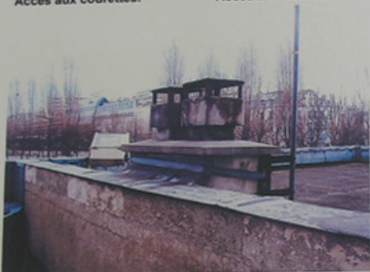
Conduits parasites sur les toitures terrasses.