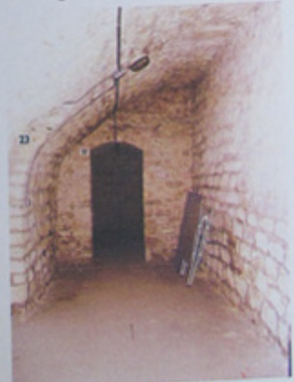
Passage entre salles voûtées.

Paris XIX e - Rotonde de la Villette - Restauration du clos et couverts Jean-François LAGNEAU - Architecte en chef des Monuments Historiques - Avril 2009 8