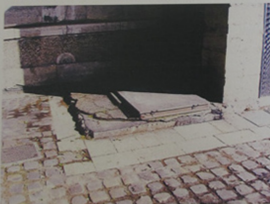
Vue du traitement de sol des abords immédiats.