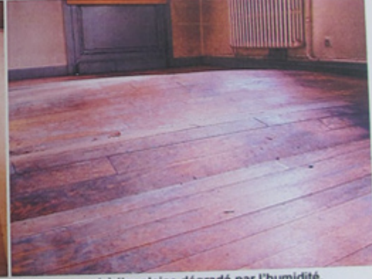
Plancher posé à l'anglaise dégradé par l'humidité.